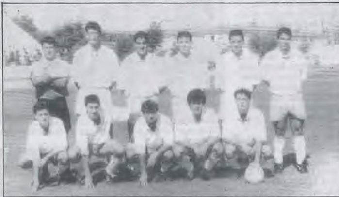
Formación del C.D. Alcalá que supo sacar un punto de su visita a Los Montecillos.

tas. Todo a pesar de que su juego en los tres últimos partidos no ha sido brillante. De cualquier forma no ha perdido y encara el mes de Octubre con cuatro duelos más asequibles.